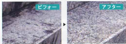
「人工ダイヤモンド」を配合した特殊な消しゴムで、洗剤やタワシでは落ちなかった頑固な水垢汚れも落とします。