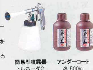
簡易型噴霧器 トルネーダ2