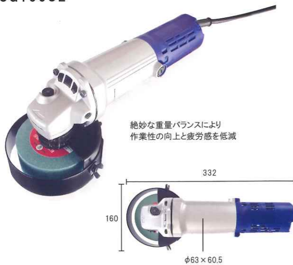
絶妙な重量バランスにより 作業性の向上と疲労感を低減